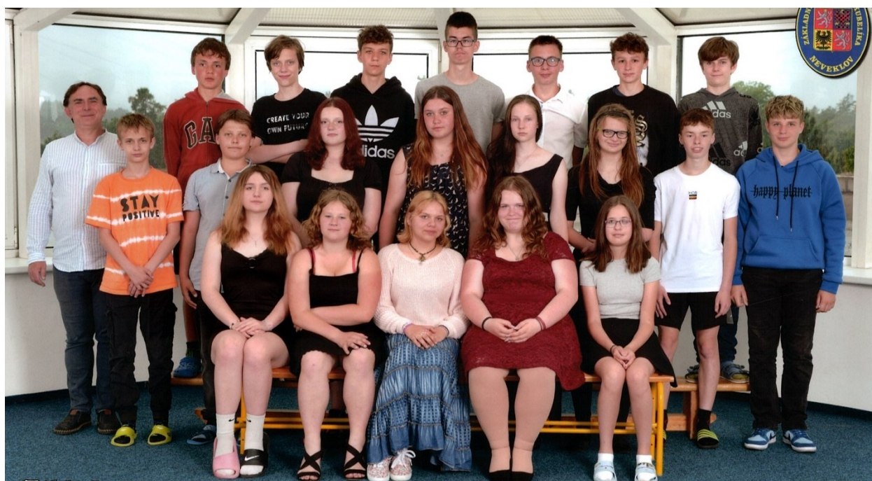
9 Vycházející žáci 9.B