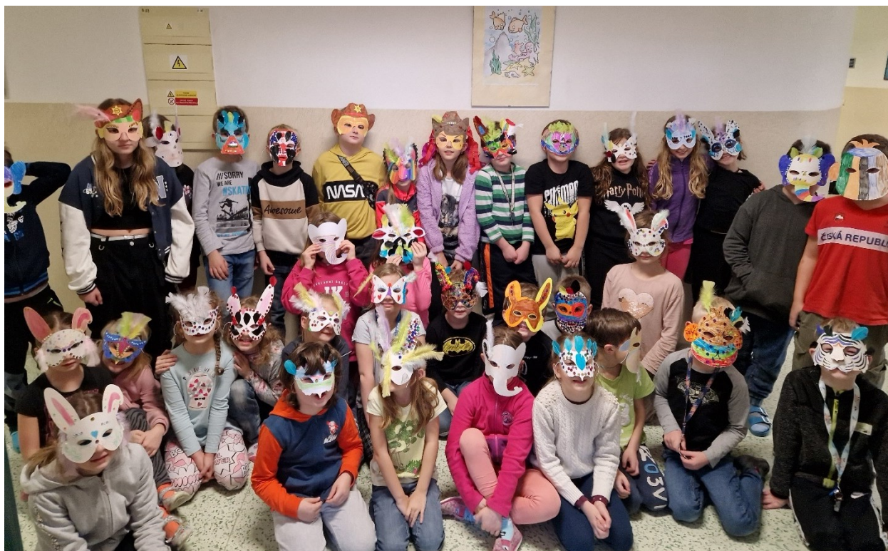
11 Děti ze školní družiny vyráběly karnevalové masky.

Ve škole se nachází také schránka důvěry. Žáci mají možnost využít klasické schránky v prostoru školy, e-mailového kontaktu na ředitelku školy či stránek projektu Nenech to být (NNTB), který pomáhá v boji proti šikaně a vyloučení z kolektivu.