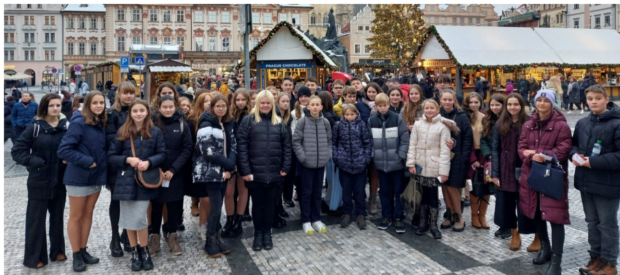
20 KMD stihl ještě před prvním představením navštívit adventní trhy v Praze.

I v tomto školním roce se žáci II. stupně mohli díky členství v Klubu mladého diváka vydat do pražských divadel. První představení, tanečně vzdělávací pořad Elixír, navštívili žáci v Městské knihovně v Praze. Druhým představením byla inscenace Amberville – Plyšový gangsteři v Divadle v Dlouhé. Dále zhlédli klasickou hru Williama Shakespeara Sen noci svatojánské v Divadle pod Palmovkou. Poslední představení, doplněné o návštěvu Národního filmového muzea NaFiLM, byla hra Tesla v Divadle Komedie.