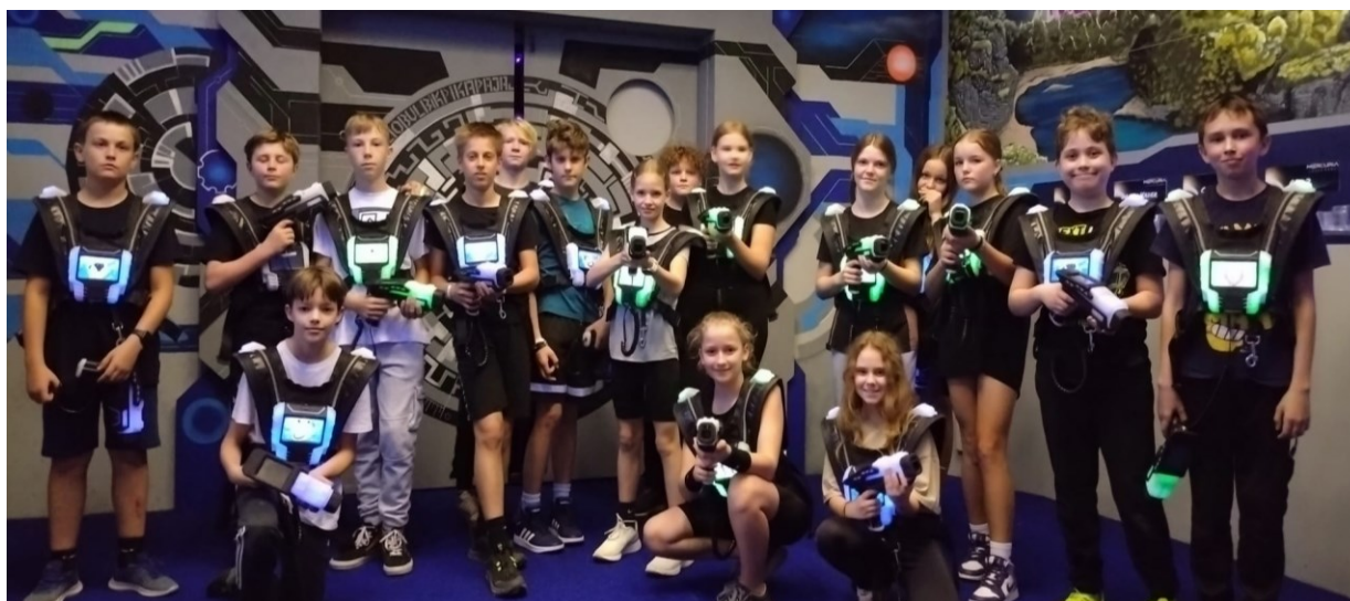
10 6.B si vyzkoušela lasergame.

Hlavním cílem preventivních aktivit bylo předcházet projevům rizikového chování, zdokonalování schopností žáků ve zvládnání stresových a krizových situací a zejména vytváření pozitivního klimatu na škole a při výuce během celého školního roku. Z velké části jsme se také zaměřili i na prevenci užívání omamných a psychotropních látek. Podporovali jsme spolupráci žáků napříč ročníky a konání společných akcí. Zapojili jsme se také do pilotního testování aplikace Younglink, která je zaměřena na hodnocení vztahů ve třídě. Testování se zúčastnily vybrané třídy ve spolupráci se školní psycholožkou.