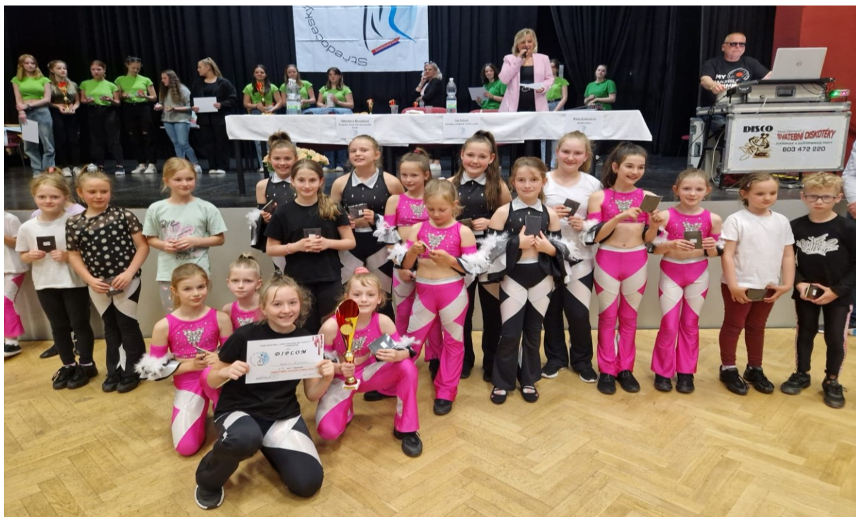
16 Tanečníci z TK Slimka získali 3. místo v taneční soutěži.

Žáci 2. stupně se vydali na třídní sportovně-turistické výlety. Šestáci poznávali Černou v Pošumaví a Lipno, sedmáci Hradec Králové, 8.A Živohošť, 8.B Jinolice a Jičín, 8.C Třeboň, 9.A Roudnici nad Labem a Říp a 9.B Doksy, Bezděz a Máchovo jezero. Mladší žáci vyzkoušeli sportovní aktivity v Miráku v Milovicích či v Farmaparku Soběhrdy.