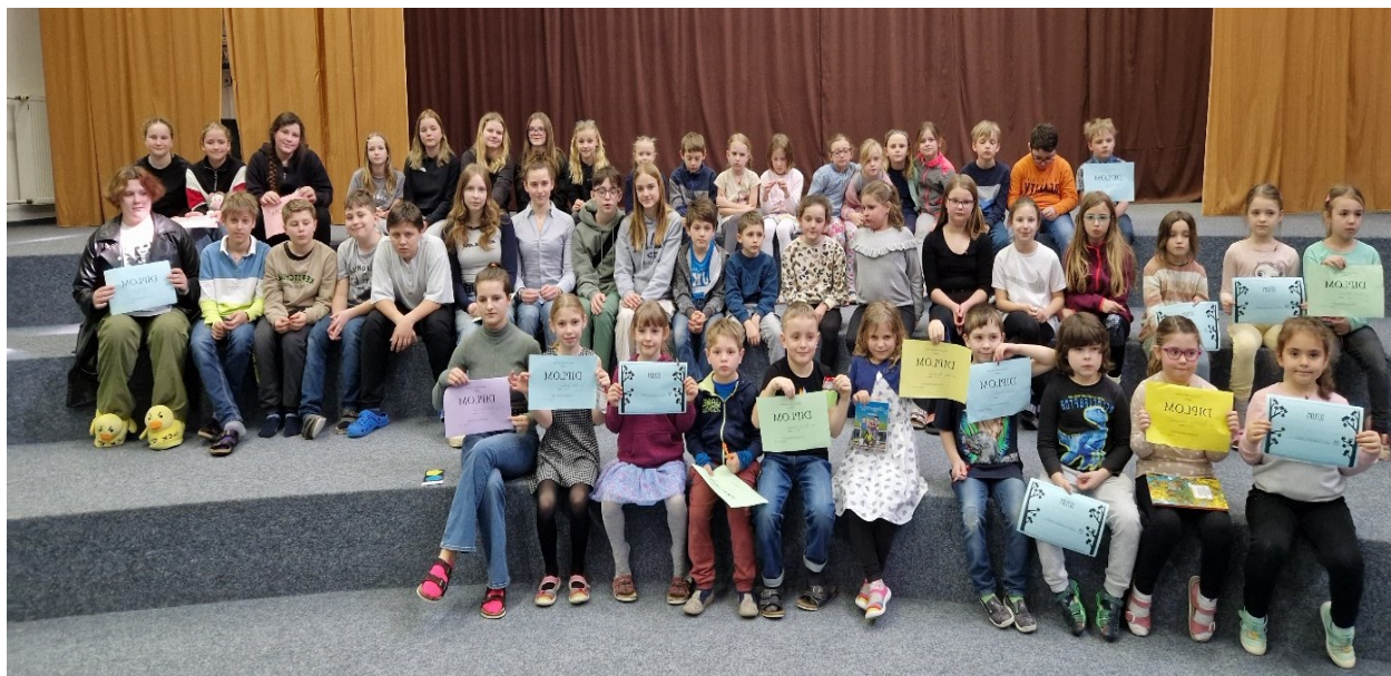
12 Velký zájem projeví žáci o školní kolo recitační soutěže. Výherci z jednotlivých kategorií školu dále reprezentovali v okresním kole v Benešově.