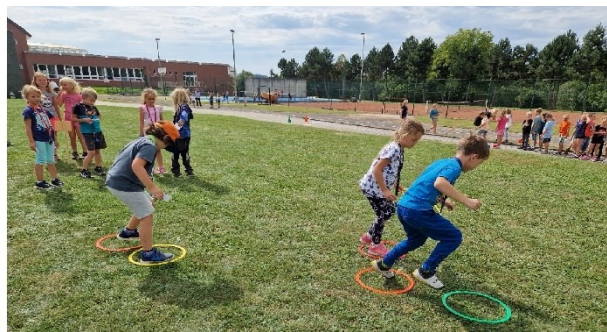
6 Podporujeme pohyb žáků. Žáci soutěžili nejen v rámci výuky tělesné výchovy, ale i ve školní družině.