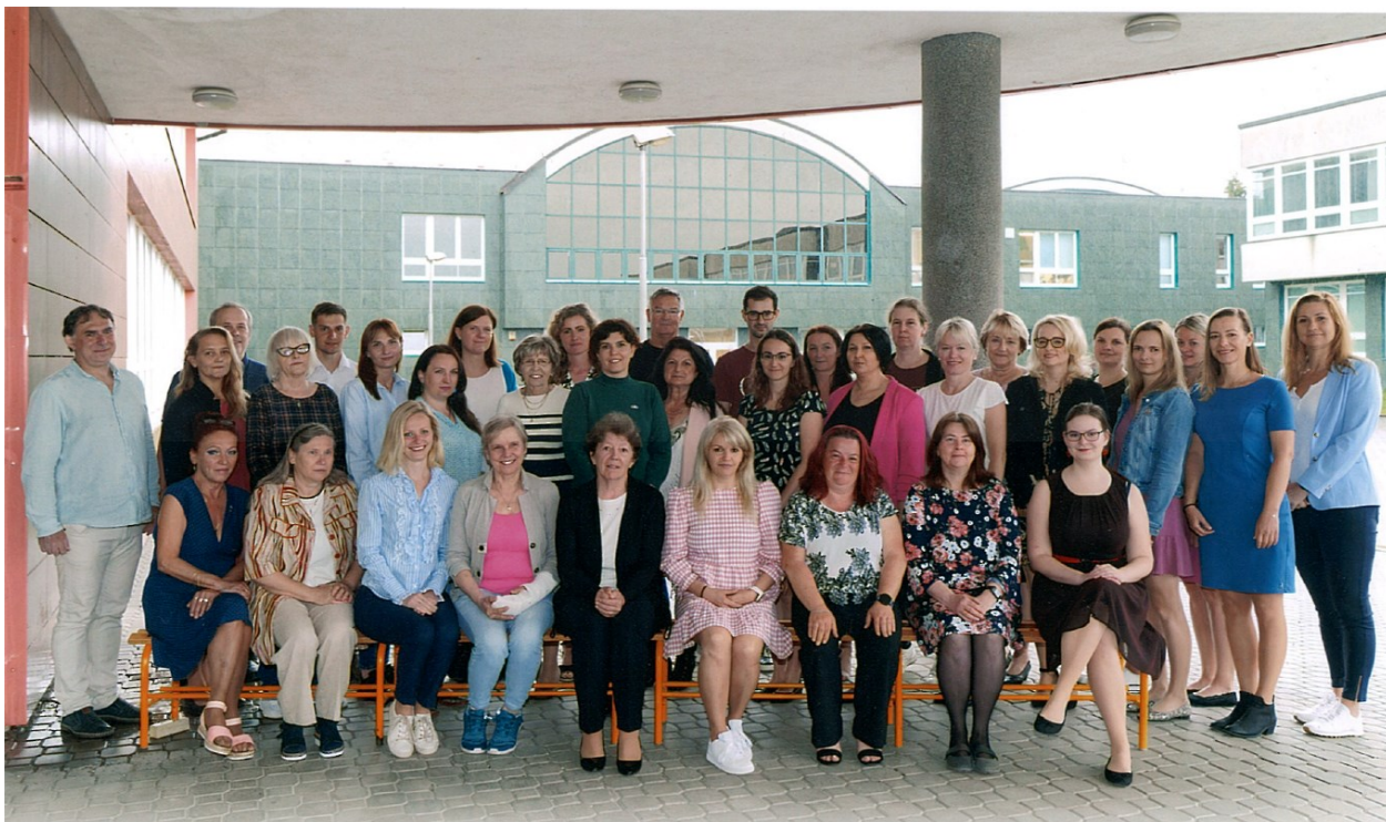
3 Pedagogický sbor školy