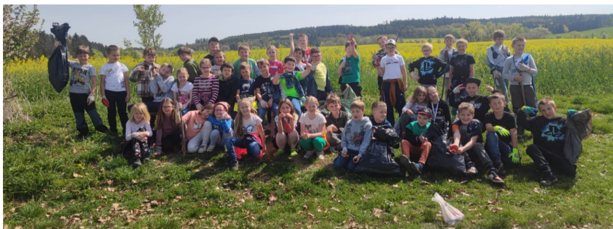
105 I druháci se vydali uklízet okolí Neveklova.

V dubnu jsme se na environmentální výchovu více zaměřili. Zapojili jsme se do akce Uklidme svět – uklidme Česko a uklidili jsme okolí školy, Neveklov i blízké okolí. V rámci Dne Země si žáci zopakovali vše o ochraně planety a životního prostředí. Všechny třídy se také vydaly do přírody. Turistické pochody spojily s úklidem, poznávaly přírodu, soutěžily a vyráběly z přírodních materiálů. Kromě do neveklovského parku a ke studánce v Koutech, vyrazily na Stejc, Neštětickou horu i na Kožlí.