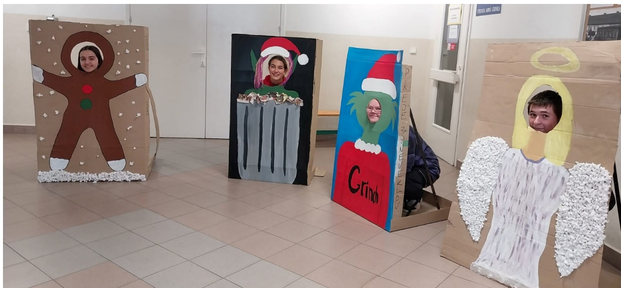
18 Fotostěny, které vytvořili žáci v hodině výtvarné výchovy.

Zabývali jsme se i výtvarným uměním. Některé třídy se účastnily výukových programů Muzea umění a designu v Benešově. Své projekty žáci vytvářeli i během hodin výtvarné výchovy. O Vánocích jsme mohli vidět jejich fotostěny, na jaře jsme hodnotily modely hradů a zámků. Velkým projektem žáků druhého stupně bylo malování dveří. Společnými silami navrhovali jednotlivé motivy a své návrhy poté zrealizovali. Dveře od toalet se tak proměnily v umělecká díla.