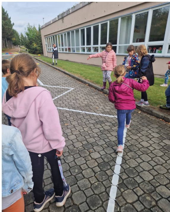
1 Děti ze školní družiny zkouší novou opičí dráhu u školy.