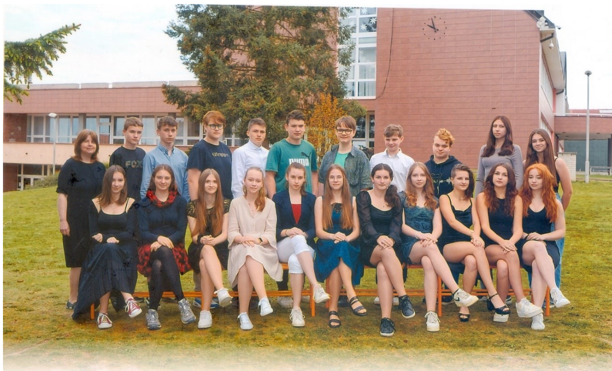
8 Vycházející žáci 9.A