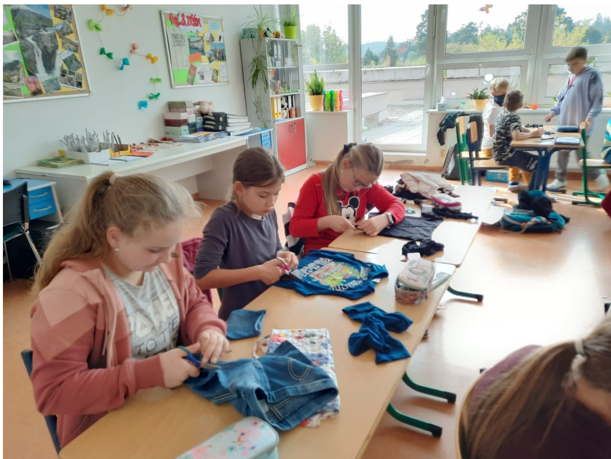
2 V rámci projektu Recyklohraní se žáci 5.B vydali po stipách Plýtváka šatního a ze starého oblečení vytvorili hračky pro domácí mazlíčky.