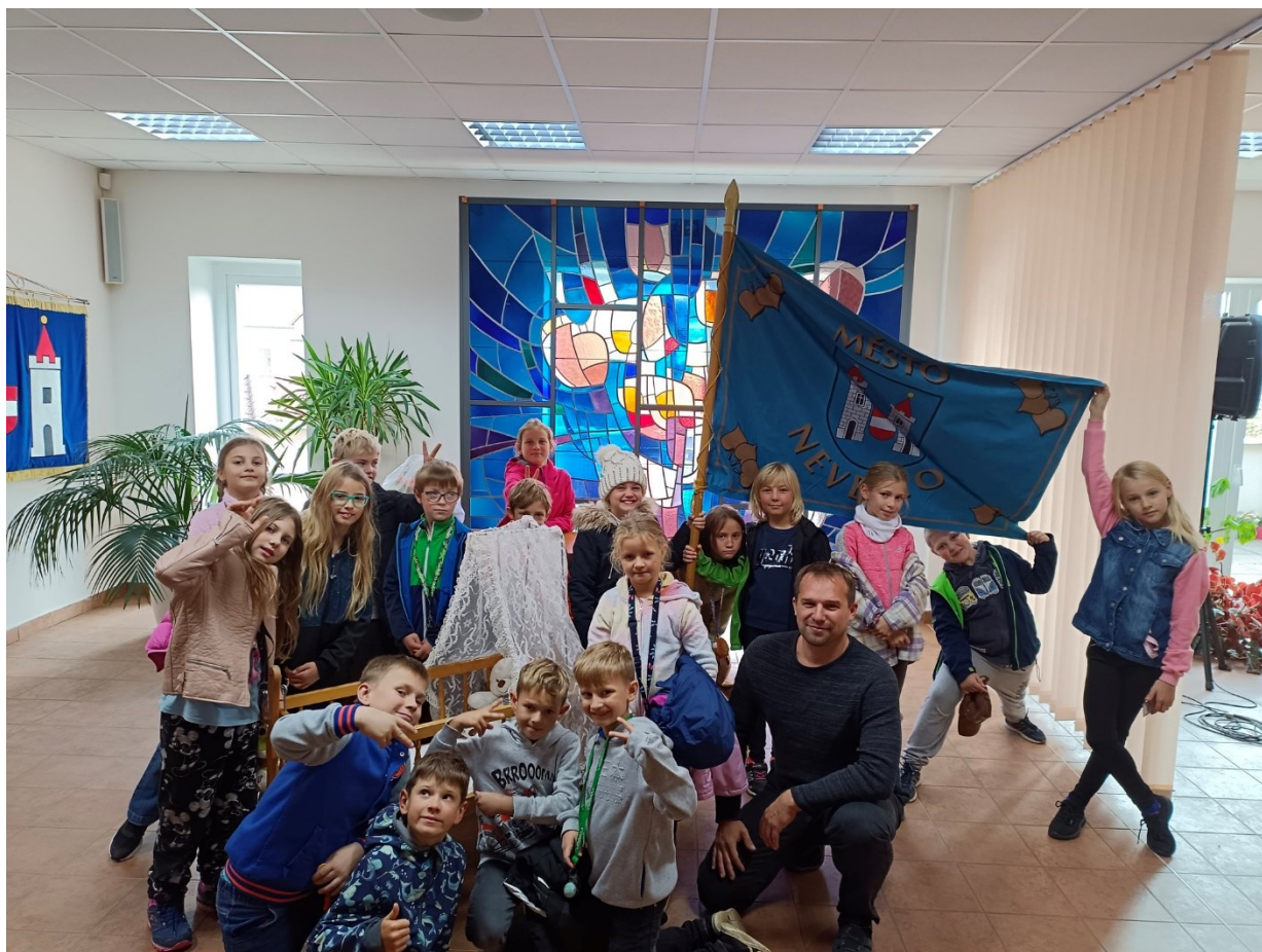
5 Žáci 3.B navštívili Městský úřad Neveklov a besedovali s panem starostou.