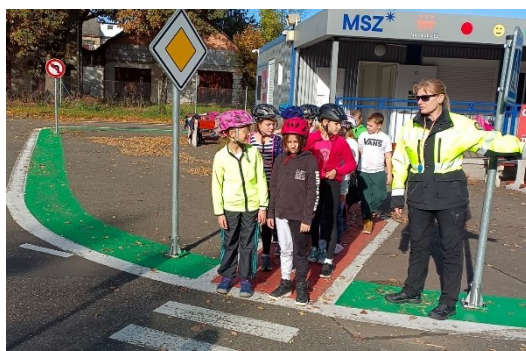
19 Na dopravním hřišti v Benešově

Na dopravní hřiště v Benešově ovšem vyrazily i další třídy prvního stupně – 2. a 3. ročník., prvňáci navštívili dopravní hřiště ve Štětkovících.