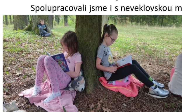
83 Žáci 2.B si vyzkoušeli čtenářskou dílnu v přírodě.

Žáci z 1. stupně i školní družina navštívili různé knihovny. Školní družina se vydala do našeho studijního centra s knihovnou. Druháci vyrazili do Městské knihovny Benešov na výukové programy Barevná přišerka a Hrajeme si pohádku. Další třídy prvního stupně se vypravily do neveklovské městské knihovny.