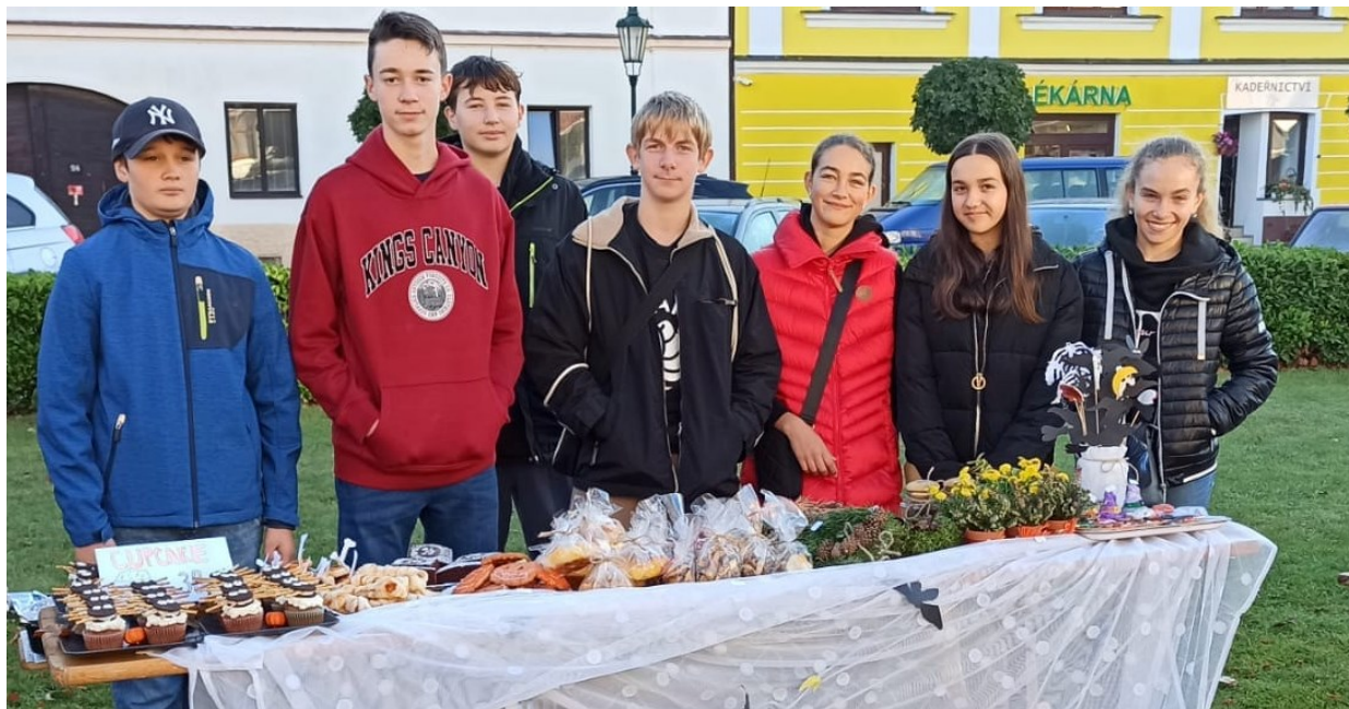
7.8.A prodávala své výrobky na podzimním trhu.

V tomto školním roce díky změnám v podávání přihlášek na střední školy (elektronické přihlášky) proběhlo setkání s rodiči vycházejících žáků, kterým byl elektronický systém představen. Výchovná poradkyně nabídla rodičům také individuální konzultace a případnou pomoc se systémem.