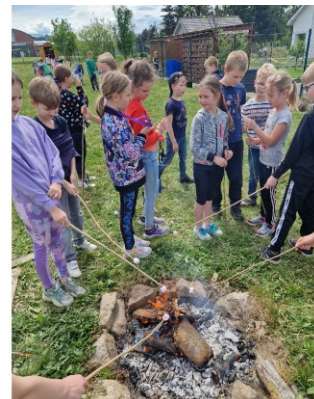
21 Aktivita ve školní družině - návštěva skláře, stavění z lega i opékání buřtů na školní zahradě