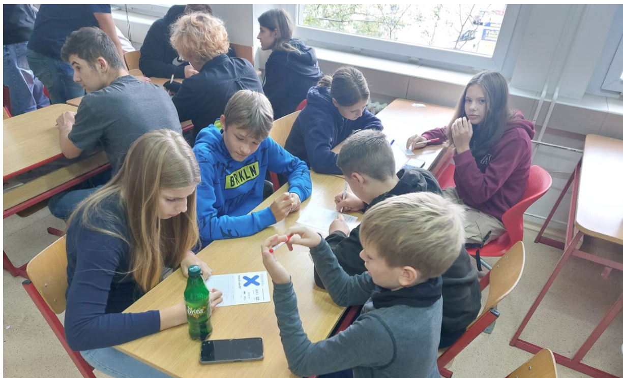
94 Soutěž našich týmů v oblastním kole piškvorek.